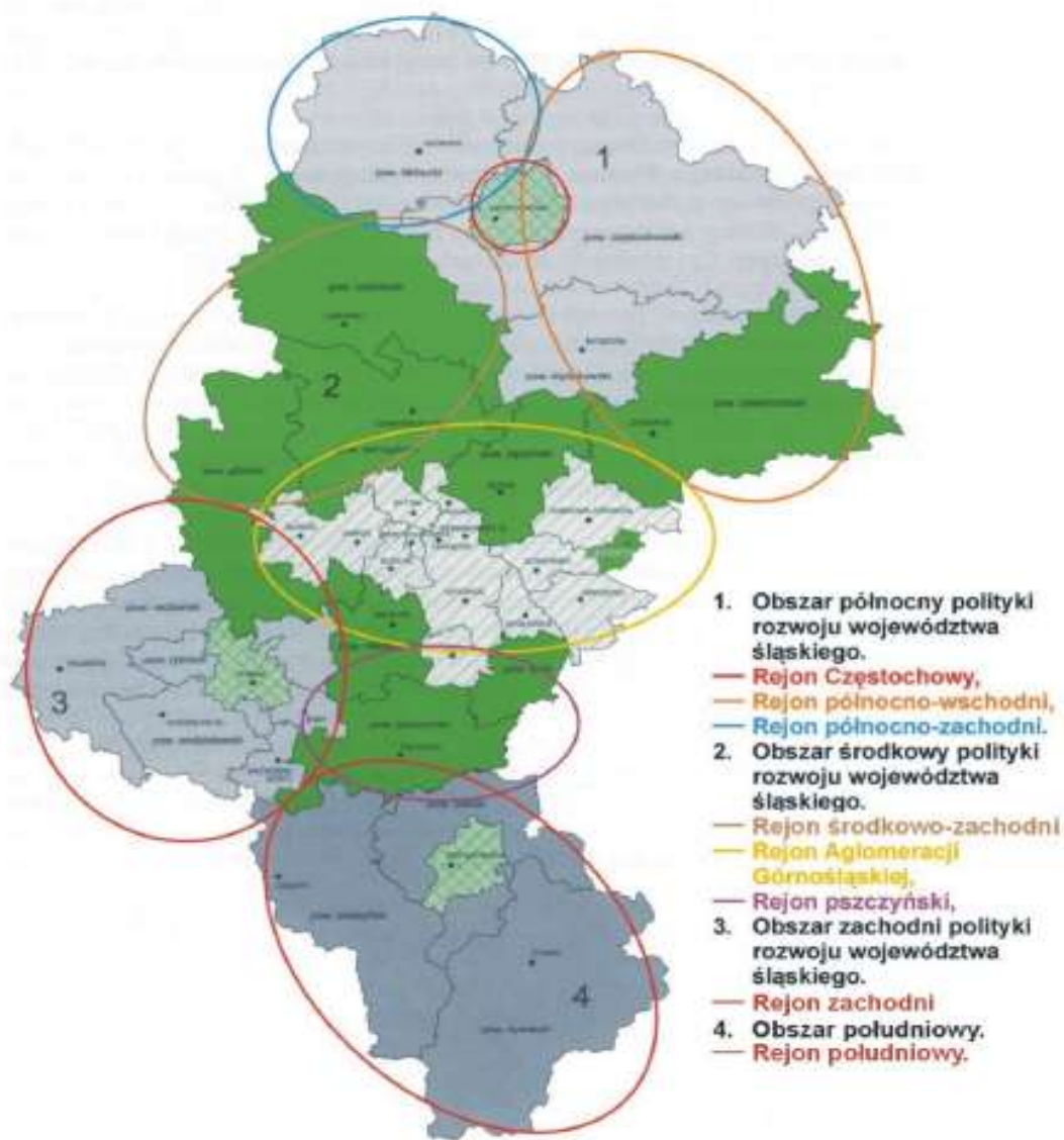
Rysunek 11. Ogólny podział na rejony turystyczne województwa śląskiego.

ruchu turystycznego na terenie i w okolicach Zawiercia odgrywa sfera zabytkowa gminy, na którą składają się m.in. ruiny XIV-wiecznego zamku Bąkowiec na terenie Ośrodka Morsko w Zawierciu-Łęczcu, kościół p.w. św. Trójcy i św. Floriana w Zawierciu-Skarżycach z 1583 roku, kościół p. w. św. Mikołaja w Zawierciu-Kromołowie z XV wieku, kolegiata p.w. św. Ap. Piotra i Pawła z roku 1900.